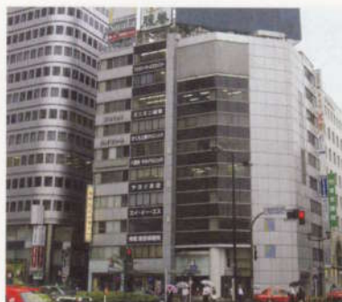
東京駅八重洲改札口を出るとすぐ目の前の立地。新幹線を利用して来院する患者もいる。